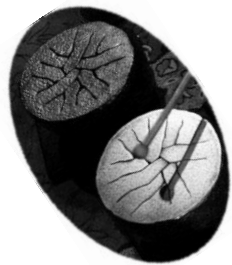
創作楽器 波紋音 斎藤鉄平作